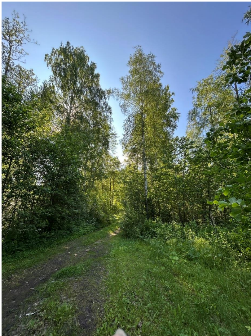
Kuva 2. Suunnittelualueetta halkova sorapintainen metsätie

Alue on loivasti kohden rantaa viettävä, poikkeuksen tekee pohjoisosassa oleva kallioinen harjanne. Alueella on rantavyöhykettä lukuun ottamatta toteutettu hakkuu 2000 -luvun alkuvuosina. Tämä on edelleen selvästi havaittavissa puustossa ja sen lajistossa. Alueella on nähtävissä kulttuurivaikutteisuus, tämä näkyy mm. viereisen asemakaava-alueen vaikutuksena sekä kohteen eteläosassa (aluetta halkaisevan tien eteläpuolella) toteutetun peltoviljelyn vaikutuksena. Alue on ollut viljelykäytössä ainakin vielä 1960 -luvulla. Merkkinä viljelystä ovat edelleen kaivetut koillis- lounaan -suuntaiset pelto-ojat.